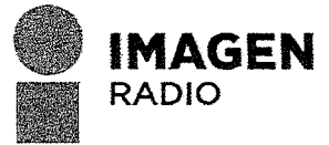
IMAGEN RADIO COMERCIAL S.A DE C.V.